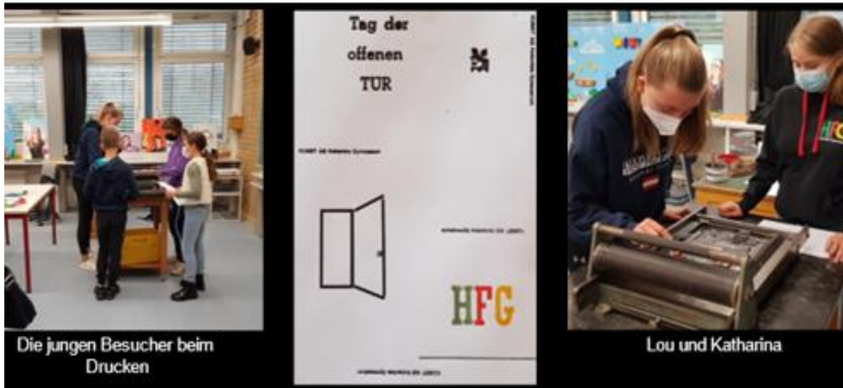
Die jungen Besucher beim Drucken

Die Kunst AG präsentierte/präsentiert ihre Arbeit auch der breiten Öffentlichkeit.