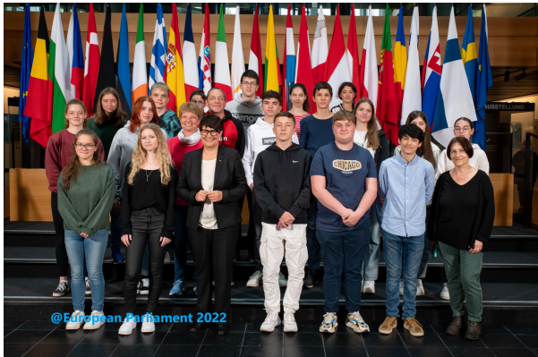
Besuch des Europaparlamentes im Rahmen einer Drittortbegegnung in Straßburg mit unserer Partnerschule in Auxerre

Individuelle Austauschprogramme sowie Schüleraustausche und Drittortbegegnungen mit französischen Schulen stärken das sprachliche Selbstbewusstsein und die Motivation für die Fremdsprache.